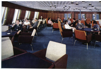
England – England's første classes rygesalon med udsigt fremad i skibets sejlretning.

ØK-skibe stod han også for indretningen af. Da jeg i 1940'erne sejlede med C.F.Tietgen, kunne jeg godt fornemme, hvor stilfuldt det var indrettet. På det tidspunkt havde jeg dog ingen fornemmelse for hvorledes telegrafisterne om natten havde kontakt med rederiets mange skibe i oversøisk fart. Modernismen gjorde sit indtog i slutningen af 1920'erne og i 1930'erne. Nogle af de toneangivende internationale arkitekter udførte også skibsdesign og i Danmark var Poul Henningsen og Kaj Fisker talsmænd for den nye tids formsprog. Kaj Fisker fik bl.a. til opgave at indrette de nye bornholmsfærger samt en del af DFDS' passagerskibe. Formsproget blev nu mere stramt og "funktionelt".