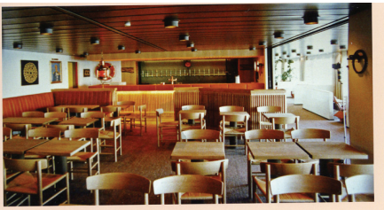
Dana Anglia – Admiral Pub med Børge Mogensen-møbler.