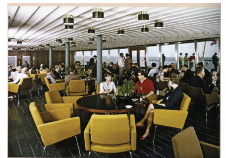
Winston Churchill – Anden classes rygesalon

På Osloruten var det bl.a. Prinsesse Margrethe og Kong Olav V.