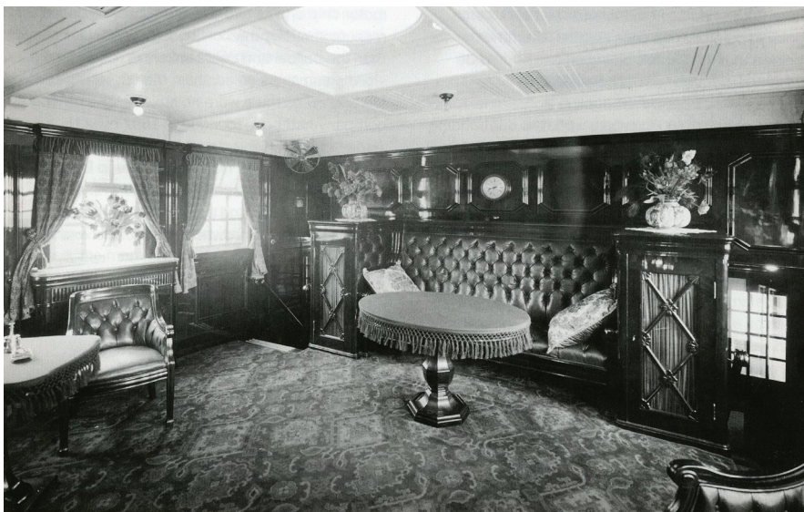
Selandia – Den ret mørke rygesalon var typisk for sin tid (Selandia bygget 1912)