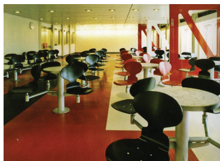
Niels Klim – cafeteria